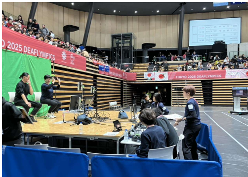
東京2025デフリンピック バasketボール競技の 日本手話言語解説現場